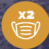
Dos mascarillas N95 o mascarillas con filtro