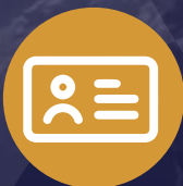
1 tarjeta de identificación de emergencia del estudiante llena y plastificada