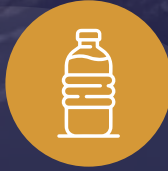
Botella de agua