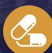
Si el estudiante tiene asma o epilepsia portar obligatoriamente su medicina