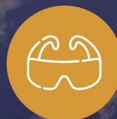
Gafas cerradas para protección de ojos ante el ingreso de ceniza